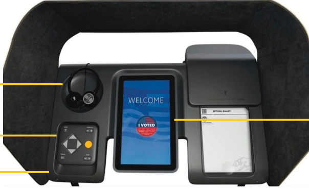
အသံ ညွှန်ကြားချက်များအတွက် နားကြပ်

မဲပေးသူများသည် အသုံးပြုသူ မျက်နှာပြင်၊ အလင်းအမှောင်၊ စာသား အရွယ်အစား၊ ဖန်သားပြင် ရှုထောင့်၊ အသံအတိုးအကျယ်နှင့် အသံမြန်နှုန်းတို့အပါအဝင် BMD ပေါ်ရှိ ဆက်တင်များကို ချိန်ညှိနိုင်ပါသည်။