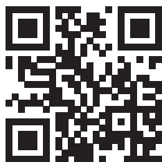
Սկանավորեք QR կոդը