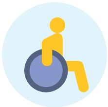
Доступность для инвалидов

Власти округа LA проведут обширный территориальный анализ, чтобы понять когда и где избиратели предпочитают голосовать.