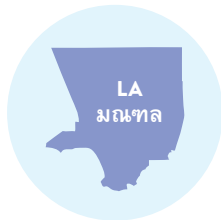
ความใกล้