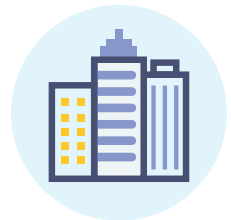
สภาพพร้อมใช้งาน