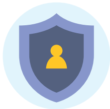
การรักษาความปลอดภัย