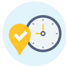
ความสะดวกสบาย